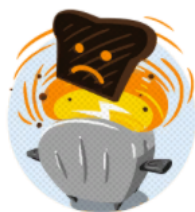
FAITES LES CHAUFFER