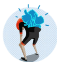
VOUS ÊTES CÉLÈBRE