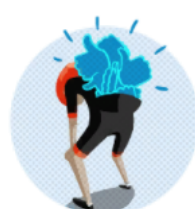
VOUS ÊTES CÉLÈBRE