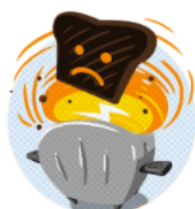
FAITES LES CHAUFFER